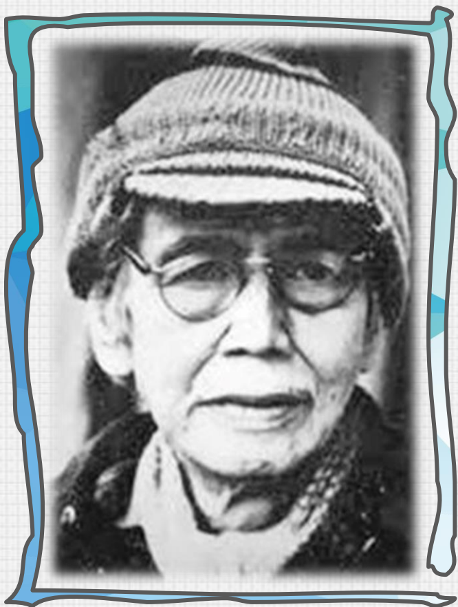
Thanh Tịnh (1911–1988)